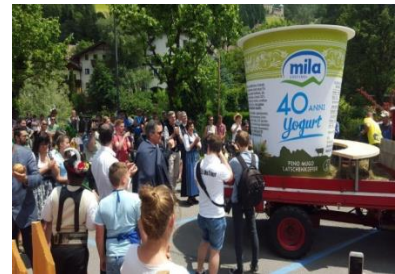
Cantina Mezzacorona (Trente)